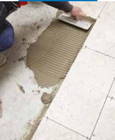
Posa di grès porcellanato con Keraflex Maxi S1 zero