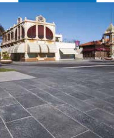
Passeggiata di Viareggio - Italia