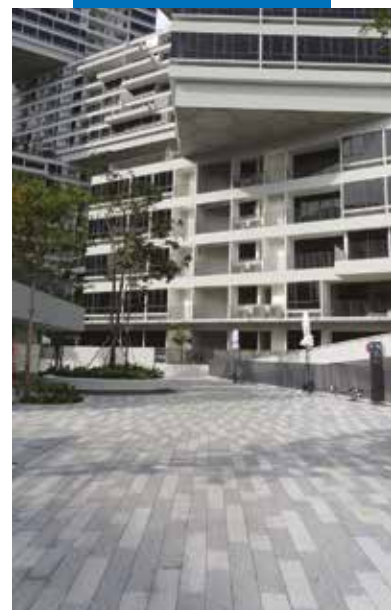
The Interlace Residence - Singapore