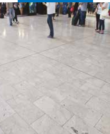
Stazione Centrale - Milano - Italia