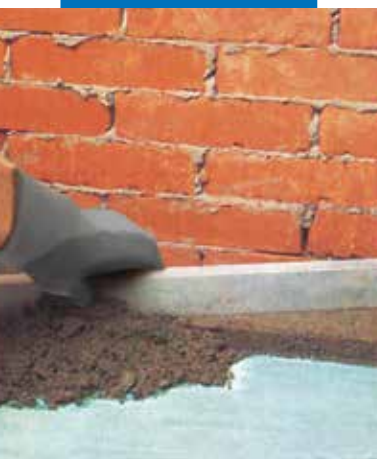
Applicazione di massetto cementizio aderente additivato con Planicrete