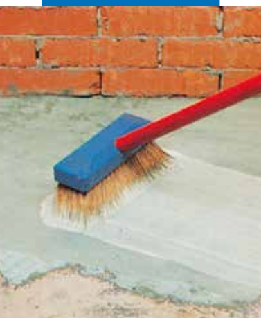
Applicazione di boiacca cementizia additivata con Planicrete