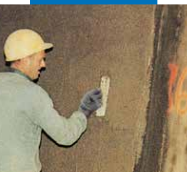
Intonaco cementizio con Planicrete. Cantiere Tunnel autostradale Ville Marie Montreal - Canada