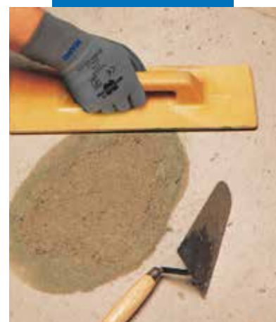
Rappezzo di pavimento: lisciatura finale