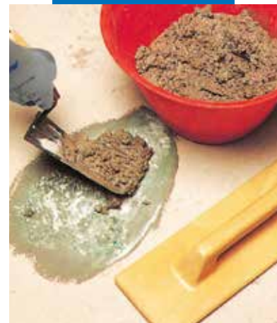
Rappezzo di pavimento: applicazione malta