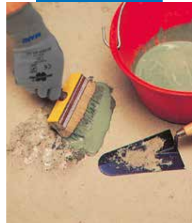
Rappezzo di pavimento: applicazione boiacca

Planicrete non è considerato pericoloso ai sensi delle attuali normative sulla classificazione delle miscele. Si raccomanda