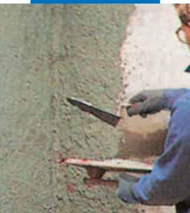
Rinzaffo adesivo additivato con Planicrete